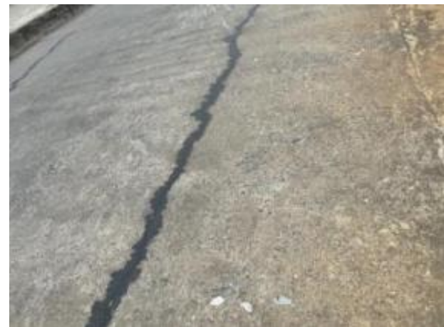
全桥桥面铺装大面积磨光露骨