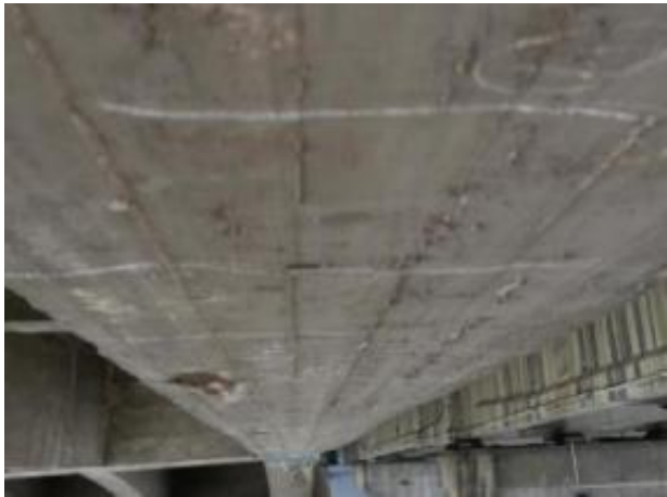
挂梁底板横向贯通裂缝