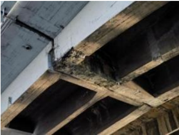
挑梁底板及侧面锈胀露筋