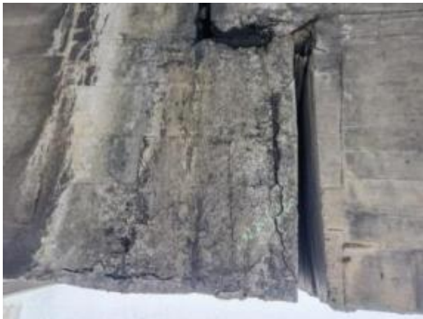
牛腿大面积锈胀露筋