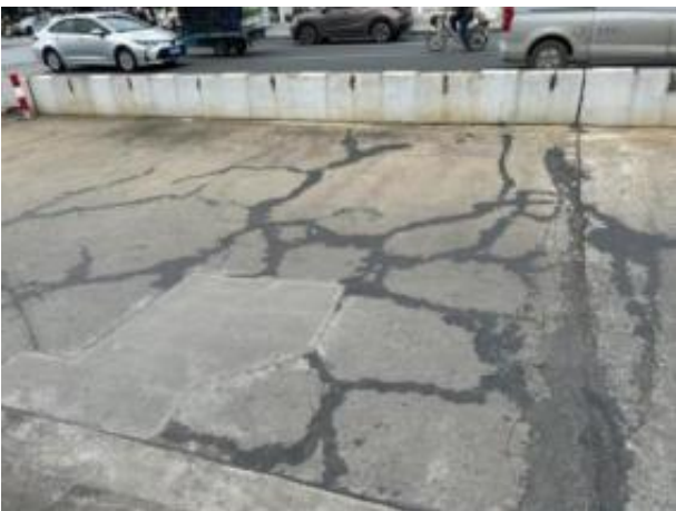
桥面铺装修补后重新开裂