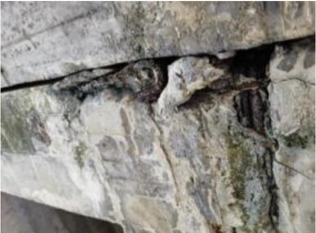
牛腿大面积锈胀露筋